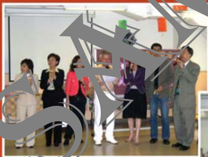
2006年10月 中秋節敬老派月餅活動