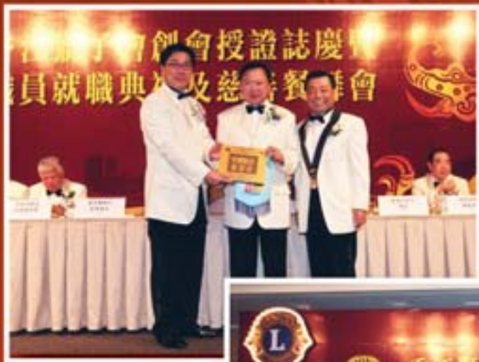
2004年4月 本會創會授證誌慶暨職員就職典禮